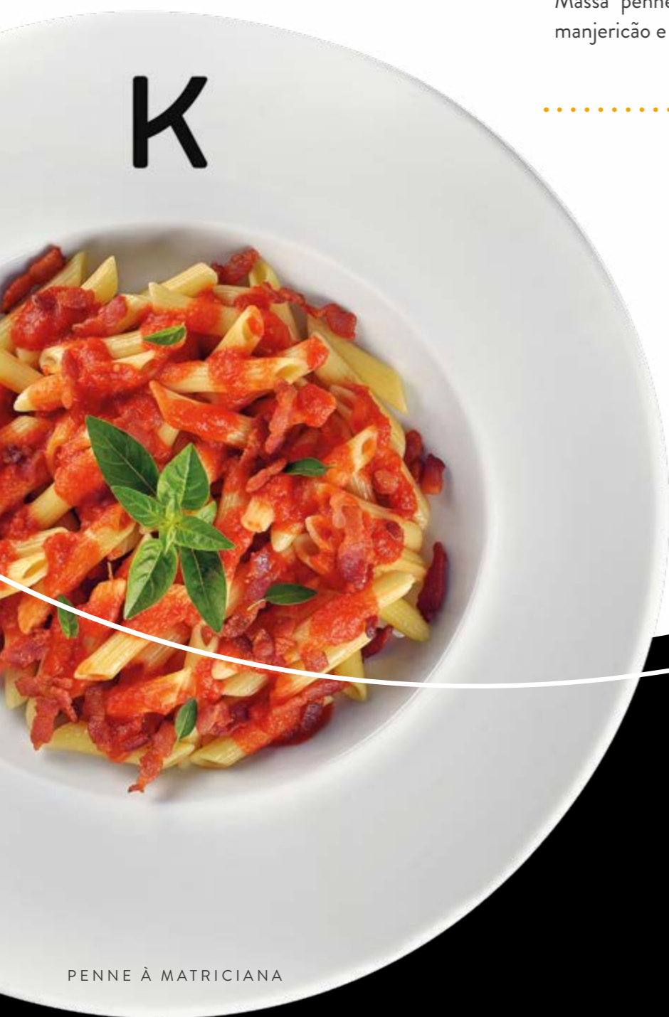
PENNE À MATRICIANA